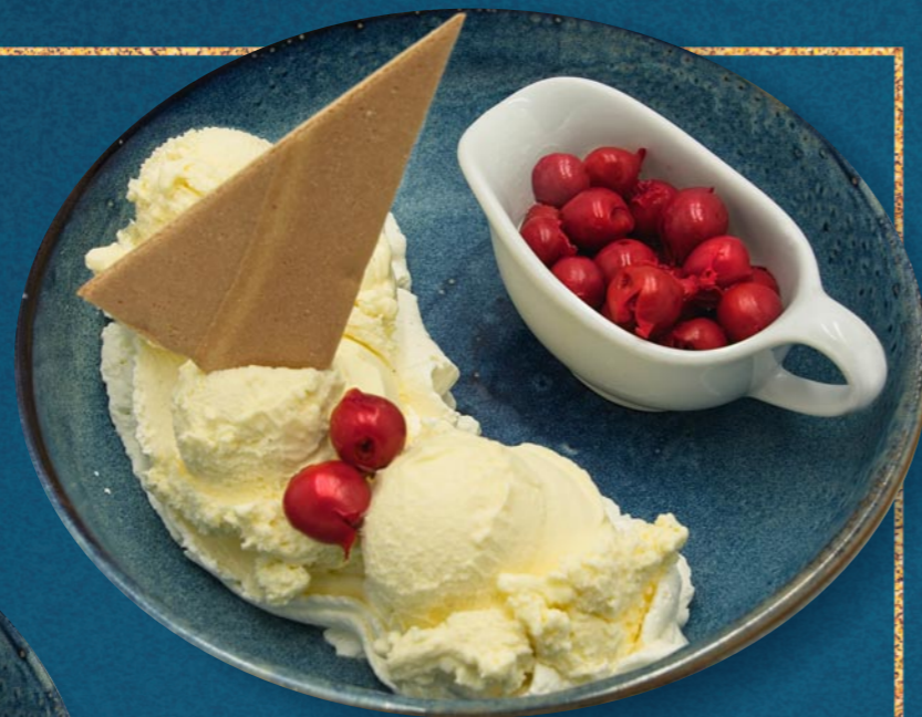
HEISSE MORELLEN € 920

Vanilleeis, heißen Himbeeren, Schlagobers