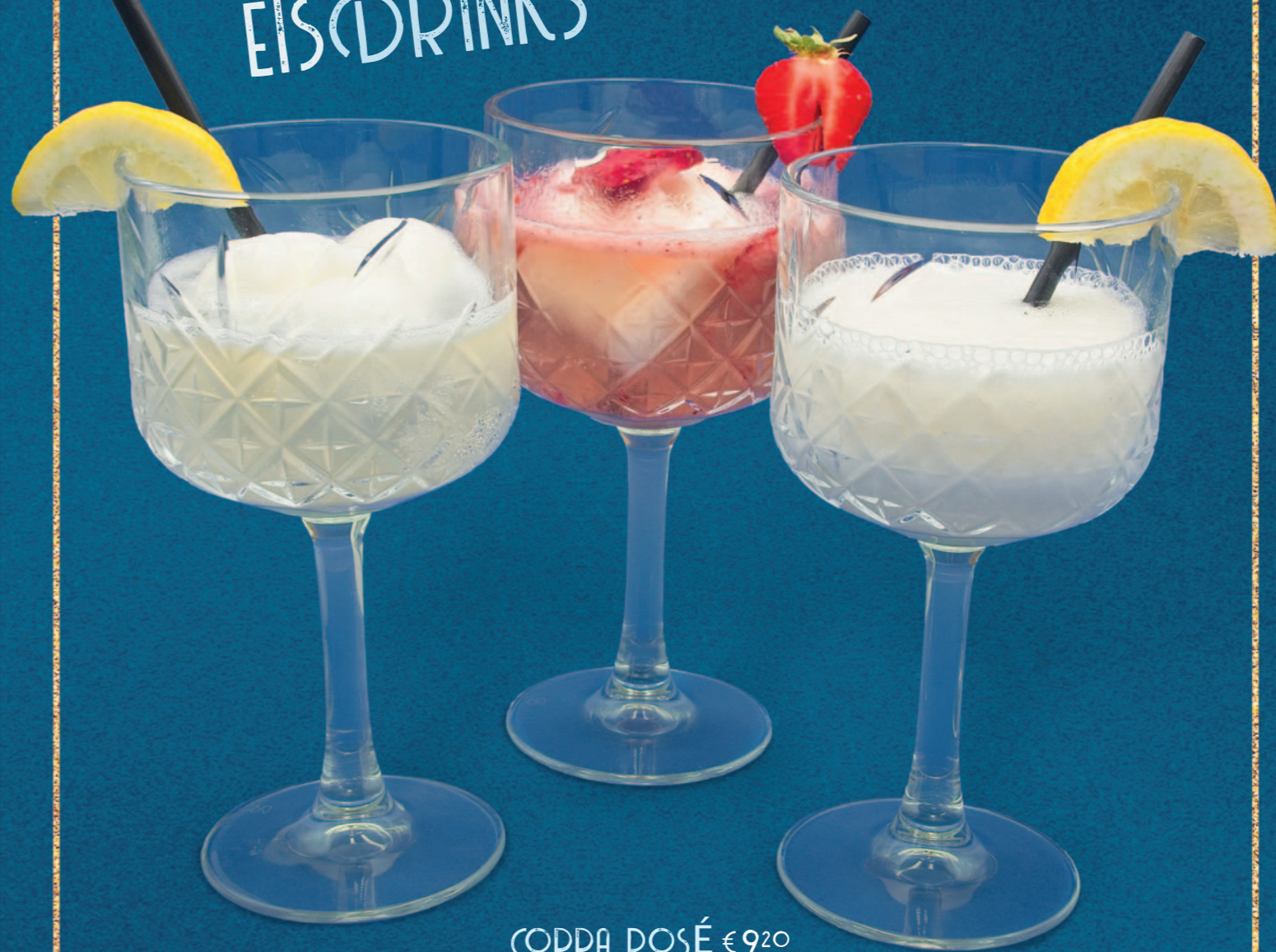
PROSECCO SORBET € 920