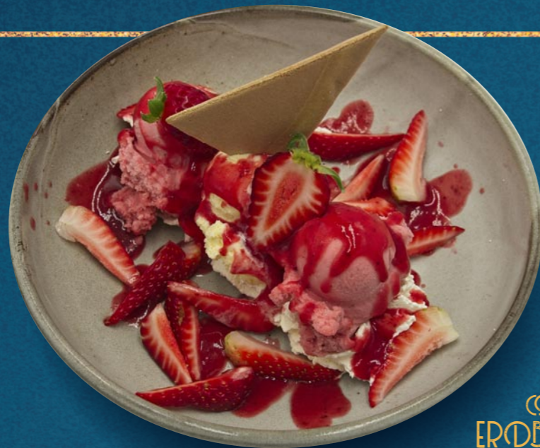
COPPA ERDBEER € 840

Feinstes natürliches GELATO Handwerk mit Liebe zum Produkt