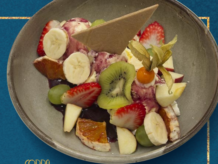
COPPA FRUCHT € 840

Gem. Eis, Erdbeeren, Kiwi, hausgemachte Erdbeersauce, Kiwisauce und Schlagobers