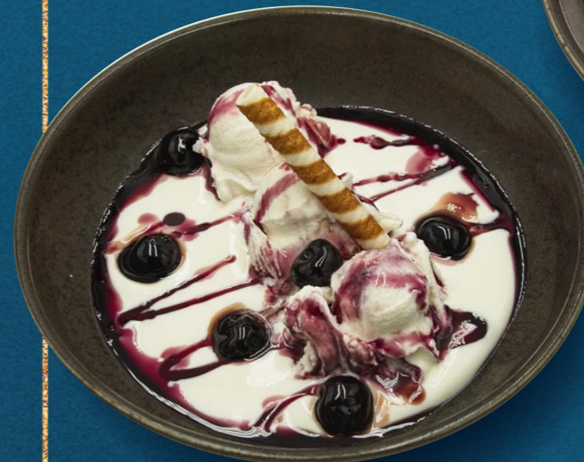
JOGHURT AMARENA € 880

Joghurt- & Erdbeereis, Natur - Joghurt, Erdbeeren, hausgemachte Erdbeersauce