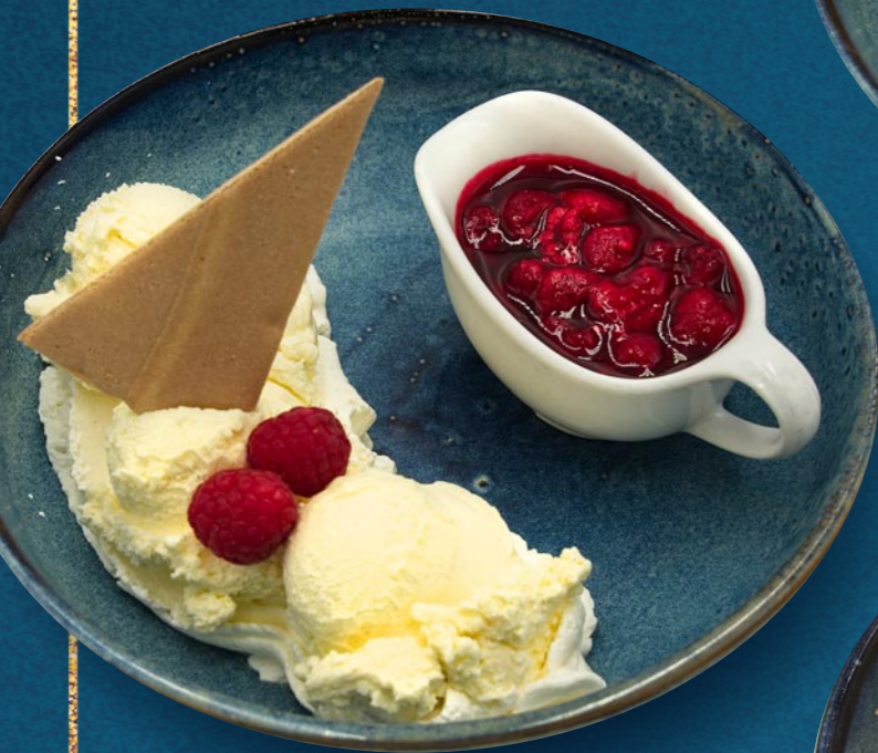
HEISSE HIMBEEREN € 920

Vanilleeis, heißen Himbeeren, Schlagobers