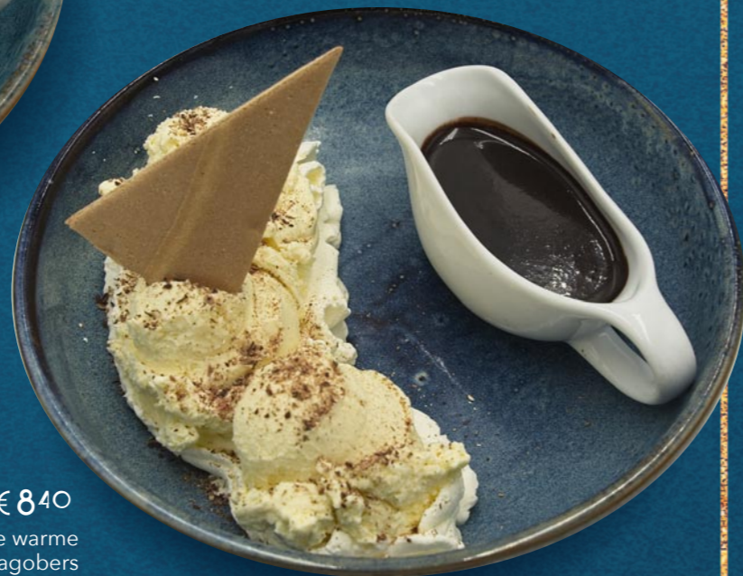
COUPE DÄNEMARK € 840

Vanilleeis, heißen Sauerkirschen, Schlagobers