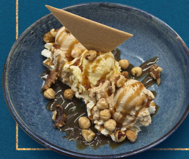
COPPA NUSS € 920

Vanilleeis, frische Kiwi, Kiwisauce und Schlagobers