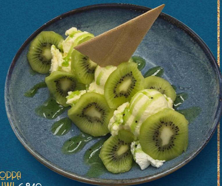
COPPA KIWI € 840

Gem. Eis, frische Früchte, Amarensauce, Schlagobers