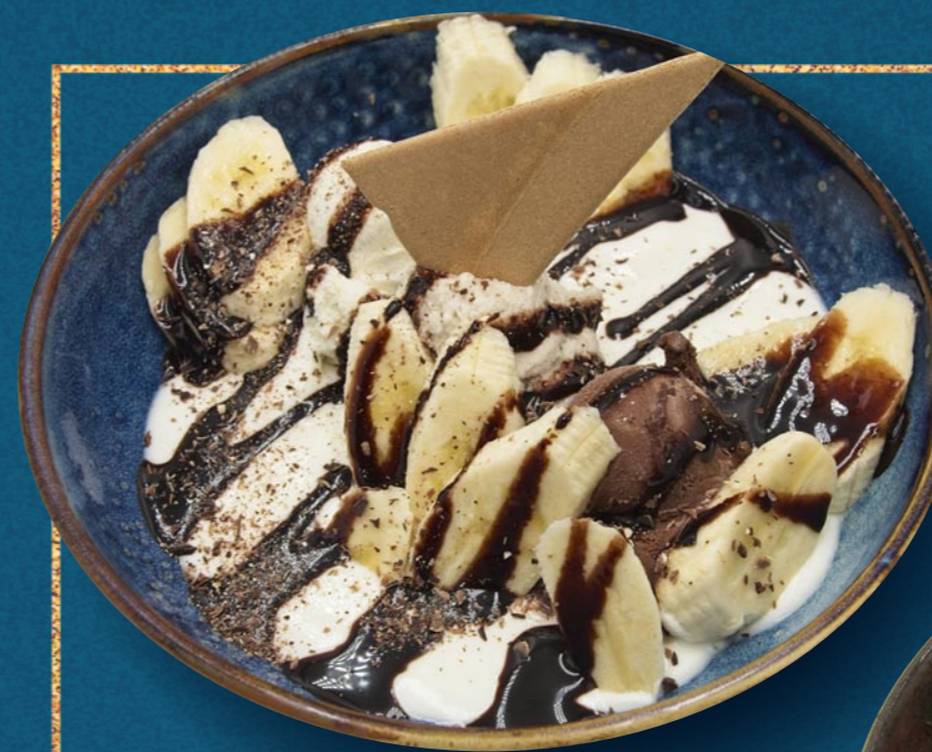
JOGHURT SCHOKO-BANANE € 880

Joghurt- & Fruchteis, Natur-Joghurt, frische Früchte, hausgemachte Erdbeersauce