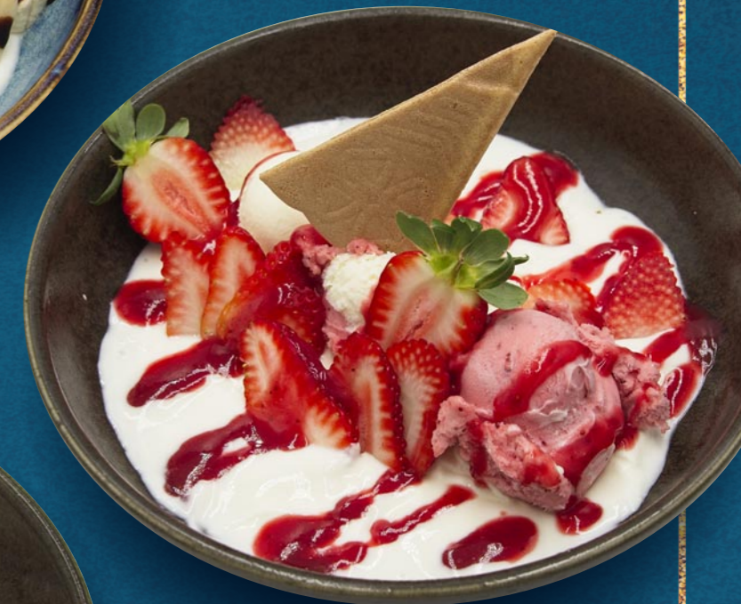
JOGHURT ERDBEEREN € 880

Joghurt- Banane- & Schokoeis, Natur-Joghurt, Bananen, hausgemachte Schokosauce