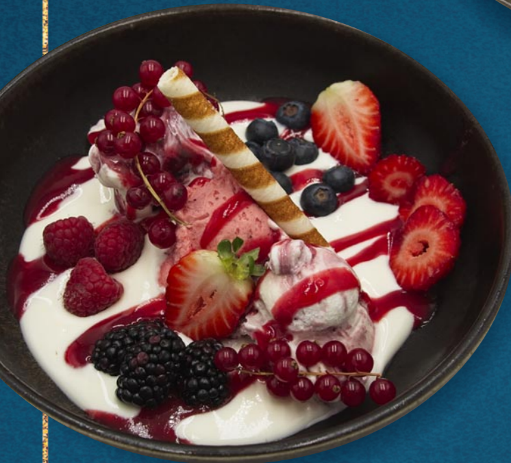
JOGHURT WALDBEEREN € 880

Joghurt- & Fruchteis, Natur-Joghurt, Kiwi, Kiwisauce