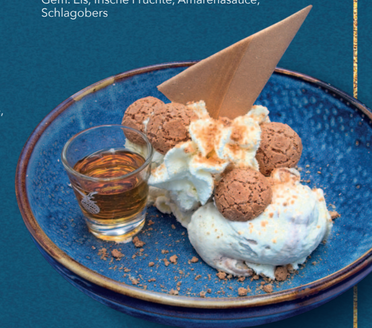
COPPA AMARETTO € 920 MIT LIKÖR

Gem. Milcheis, Nüsse, Walnüsse, Nussauce, Schlagobers