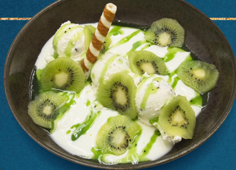
JOGHURT KIWI € 880

Joghurt- & Fruchteis, Natur-Joghurt, Kiwi, Kiwisauce