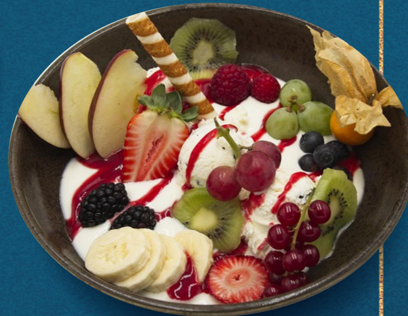
JOGHURT COCKTAIL € 920

Joghurt-, Erdbeer- & Himbeereis, Natur-Joghurt, Waldfrüchte, hausgemachte Erdbeersauce