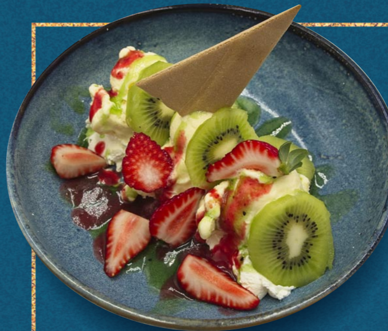
COPPA ITALIA € 980

Vanille- und Erdbeereis, frische Erdbeersauce und Schlagobers